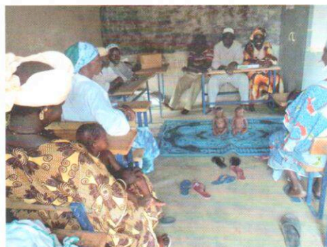
Formation des accoucheuses 2014 Village de Saré Bambara – région de Mopti

Ces deux genres de formation ont prouvé leur efficacité en touchant 191 ATR représentant 97 villages et une population d'environ 60'000 personnes .