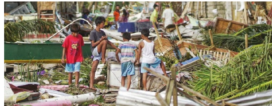
Le typhon Odette a durement touché Siargao et provoqué de nombreux dégâts sur toute l'île.