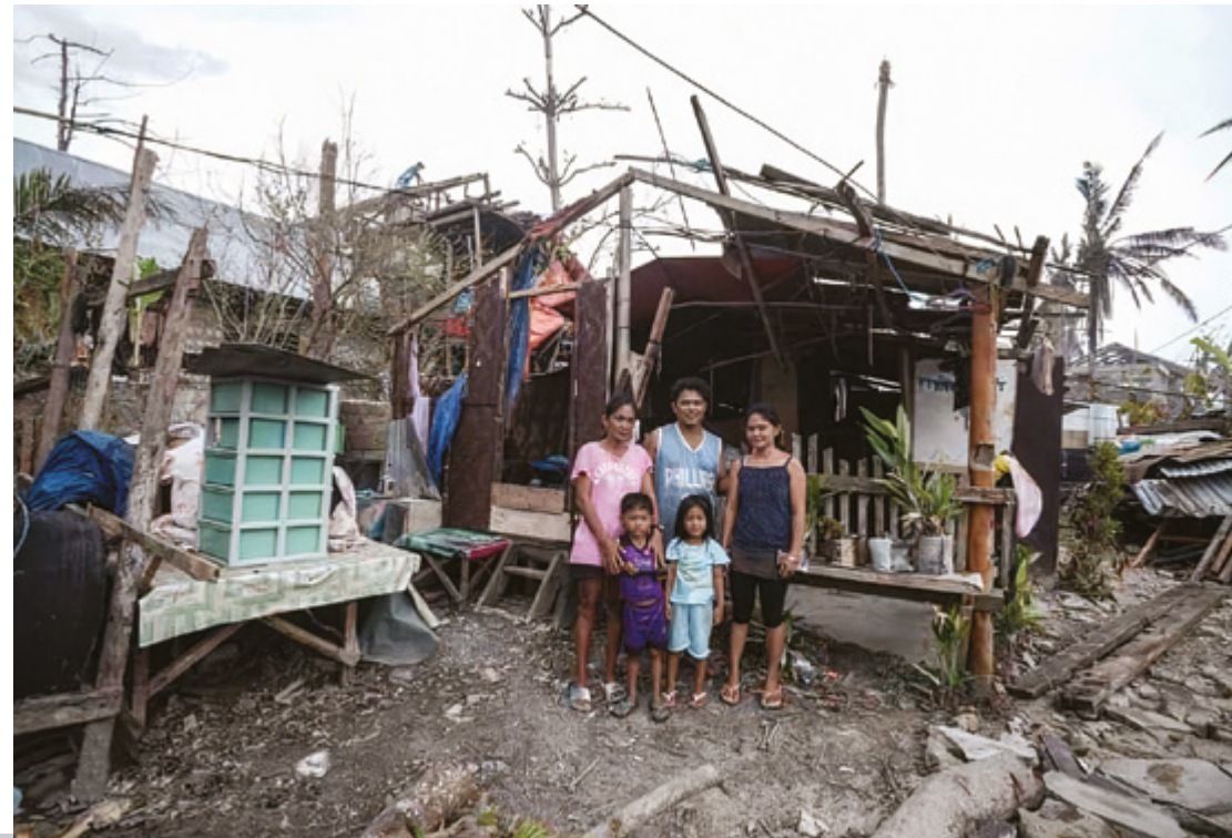
Après le passage du typhon Odette, la reconstruction s'est faite en de nombreux endroits avec les moyens du bord.

Le tourisme est revenu à petit pas après le typhon Odette mais il est là !